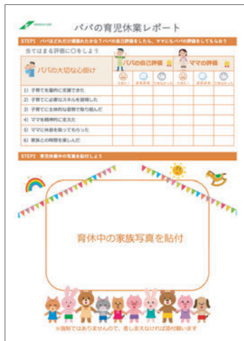
パパの育児休業レポート