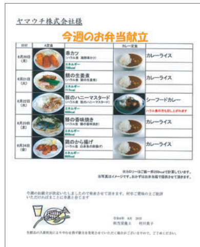
ハラール食も豊富な献立