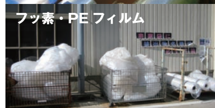
フッ素・PEフィルム

鹿沼工場では、ポリカーボネート、フッ素フィルムなどの分別を徹底し、これらの有価引き取りを実施することによって、事務消耗品などのエコ商品の生産に役立て、リサイクル事業の活性化に貢献しています。