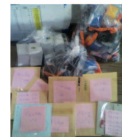
集められたベルマーク。このときは、全部で289.25点集まりました(2011年9月)

岩手県陸前高田の中学校の学用品購入を支援するため、社員でベルマークを集めて、地元の中学に送りました。