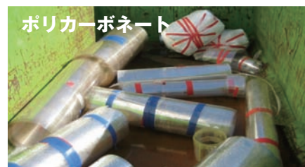
ポリカーボネート