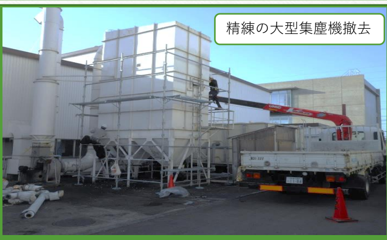
精練の大型集塵機撤去

大量生産から少量多品種生産になったことに伴い大型の集塵装置も不要になり、撤去することとなりました。1981年から35年稼働していました。