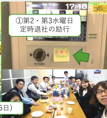
①第2・第3水曜日 定時退社の励行