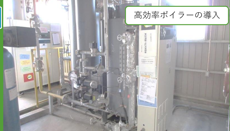
高効率ボイラーの導入

高効率ボイラーを更新時に導入しました。生産性15パーセント・省エネ率4パーセントアップしました。